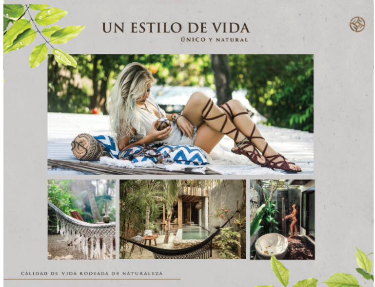
CALIDAD DE VIDA RODEADA DE NATURALEZA